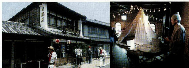
令和3年度商店街若手リーダー養成事業

千葉県中小企業団体中央会 Chiba Prefectural Federation of Small Business Association